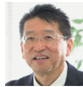
社会福祉法人三幸会 理事長