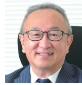
医療法人社団一穂会 西山病院グループ 専務理事