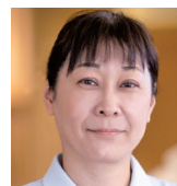
医療法人社団一穂会 西山病院グループ 介護部長