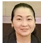
社会福祉法人聖隷福祉事業団 法人本部 人事企画部