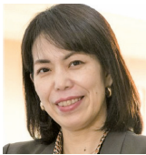
静岡県公立大学法人 静岡県立大学 経営情報学部講師 (看護師)