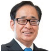
株式会社 ウィ・キャン 代表取締役 アジアヒューマンリレーション 株式会社 代表取締役社長