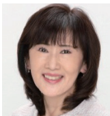
社会福祉法人 聖隷福祉事業団 理事・常務執行役員 ふじのくにEPAネットワーク代表 (看護師)