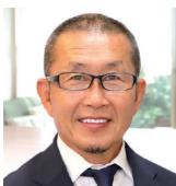
人材開発協同組合 代表理事