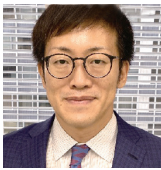
株式会社 日本ベトロ 代表取締役